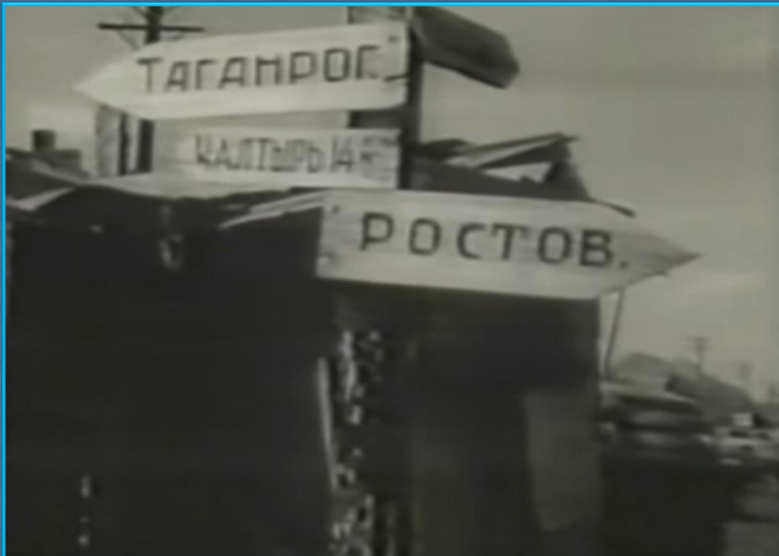
22 июня 1941 г. Германия и ее союзники напали на нашу страну. Ростов-на-Дону в планах фашистского командования был стратегической целью – как «ворота на Кавказ» - к нефти, пшенице, углю.